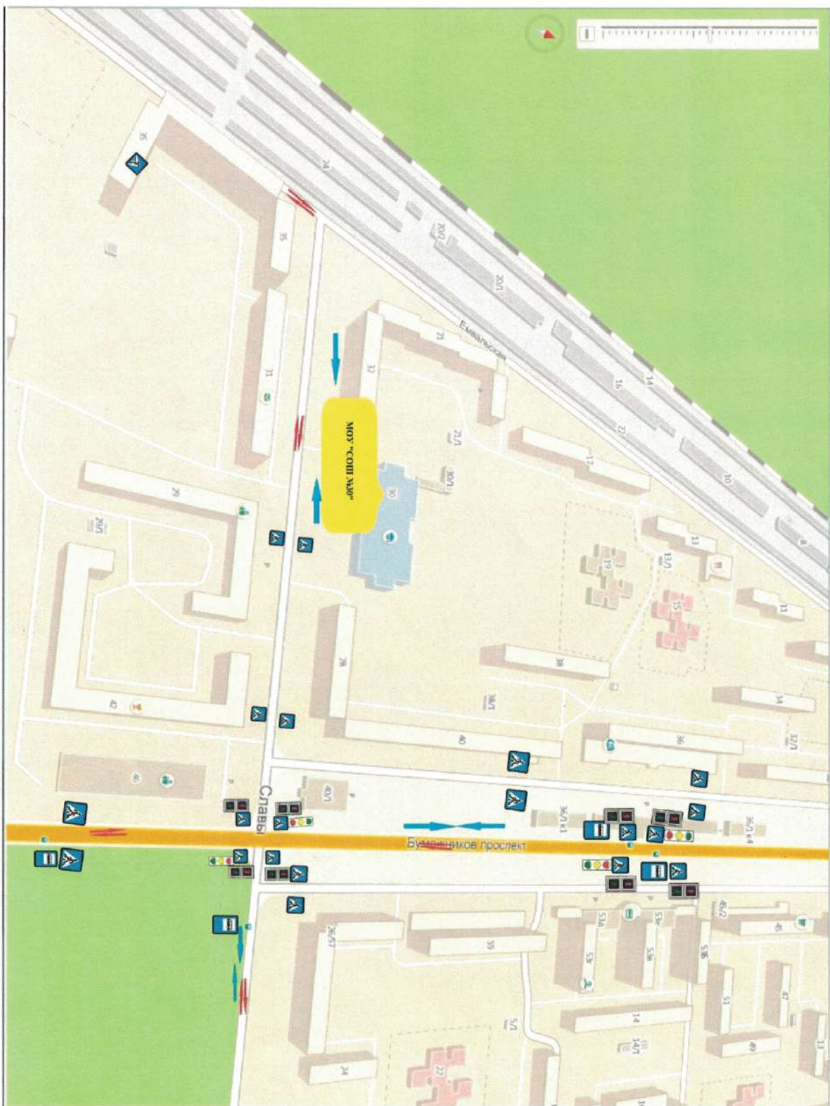
План схема района расположения МОУ «СОШ №30», движение транспорта и учащихся